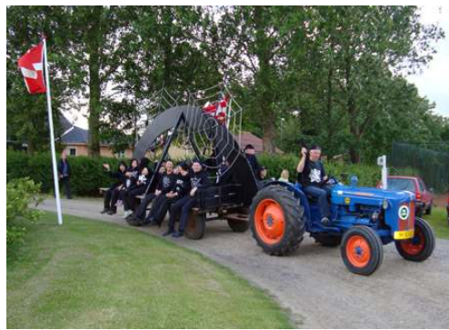
Billeder fra sidste års sommerfest